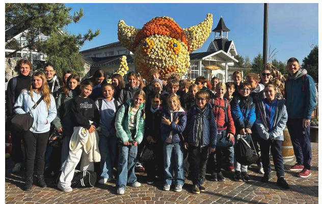
Ausflug ins Freizeitbad Rulantica

Im Jahr 2025 gab es zahlreiche Veranstaltungen wie den Tagesausflug ins Rulantica, das Adventsbasteln, das jährliche Ferienlager in der Pfalz sowie auch Meisterschaften und Wettkämpfe. Auch unser eigener Wettkampf, der Storchencup im Freibad fand statt. In der Adventszeit beteiligten wir uns an den Weihnachtsmarktenden.