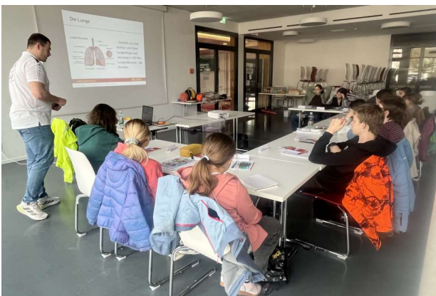
Vermittlung der theoretischen Grundlagen in der Mensa ...

Am Wochenende vom 20. bis 22. März nahmen 13 Jugendliche ab 12 Jahren an einer grundlegenden Ausbildung im Rettungsschwimmen teil. Ziel war es, das Rettungsschwimmabzeichen in Bronze zu erlangen. Die theoretischen Inhalte wurden am Freitagabend sowie an den beiden darauffolgenden Vormittagen in der Mensa der Hans-Thoma-Schule vermittelt. Dabei lernten die Teilnehmenden verschiedene Techniken zur Selbstrettung und zur Rettung anderer Personen kennen.