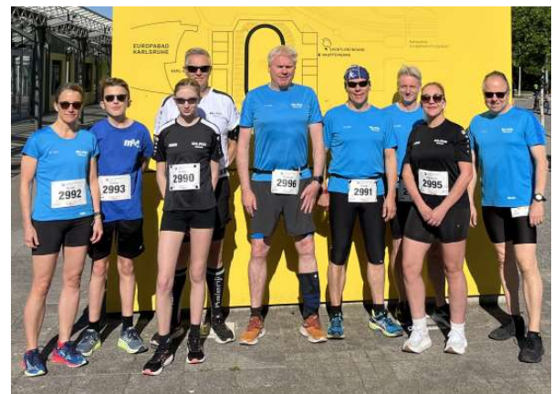
Laufgruppe bei der Badischen Meile

Die Aktiven leisteten im Sommer 2025 ehrenamtlich 812 Wachstunden im Freibad.