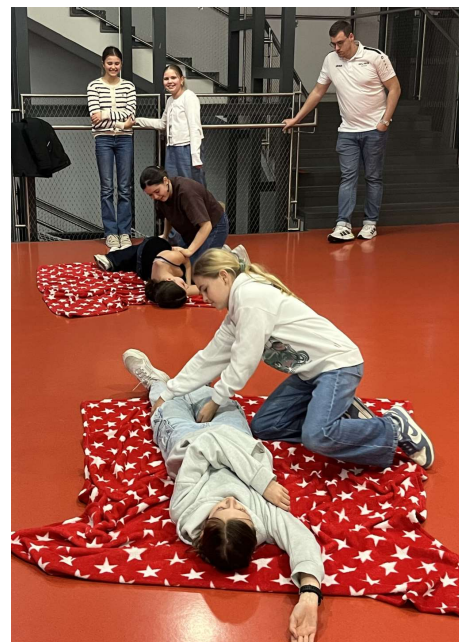
Seitenlage von Patienten nach festgestellter Atmung

Ein Schwerpunkt lag auf der Befreiung aus Umklammerungen sowie auf kombinierten Übungen, die von der Selbst- bis hin zur Fremdrettung reichten. Darüber hinaus erhielten die Jugendlichen Einblicke in die vielfältigen Aufgabenbereiche der DLRG und wurden in grundlegenden theoretischen Themen geschult, etwa in den Funktionen von Herz und Kreislauf sowie in den Basics der Ersten Hilfe.