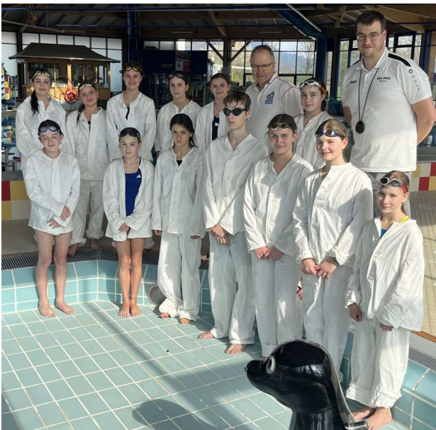
Teilnehmer und Referenten des Kurses

Durch die hohe Disziplin der Teilnehmenden konnte die Ausbildung zügig und erfolgreich durchgeführt werden und so freuen wir uns, 13 neue Aktive in den Kreis unserer Rettungsschwimmer aufnehmen zu können !