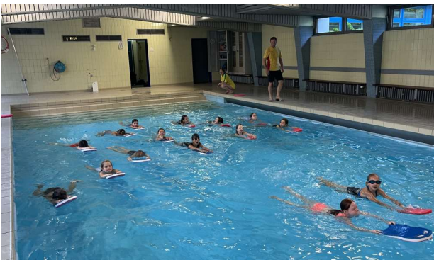
Anfänger- und Kinderschwimmen im Lehrschwimmbecken – wie lange noch ?

Im Lehrschwimmbecken der Hans-Thoma-Schule finden an allen fünf Wochentagen im Zeitraum zwischen 17:30 und 20:00 Uhr zwei Gruppen statt. Neben den Anfängerkursen verfolgen die Jugendlichen bis 10 Jahren, die Ziele der Deutschen Schwimmabzeichen