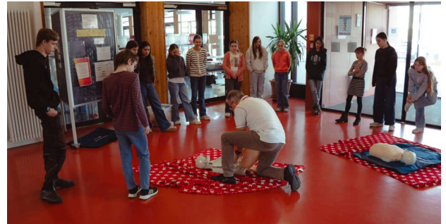
... und auf der Aktionsfläche

Ein Schwerpunkt lag auf der Befreiung aus Umklammerungen sowie auf kombinierten Übungen, die von der Selbst- bis hin zur Fremdrettung reichten. Darüber hinaus erhielten die Jugendlichen Einblicke in die vielfältigen Aufgabenbereiche der DLRG und wurden in grundlegenden theoretischen Themen geschult, etwa in den Funktionen von Herz und Kreislauf sowie in den Basics der Ersten Hilfe.