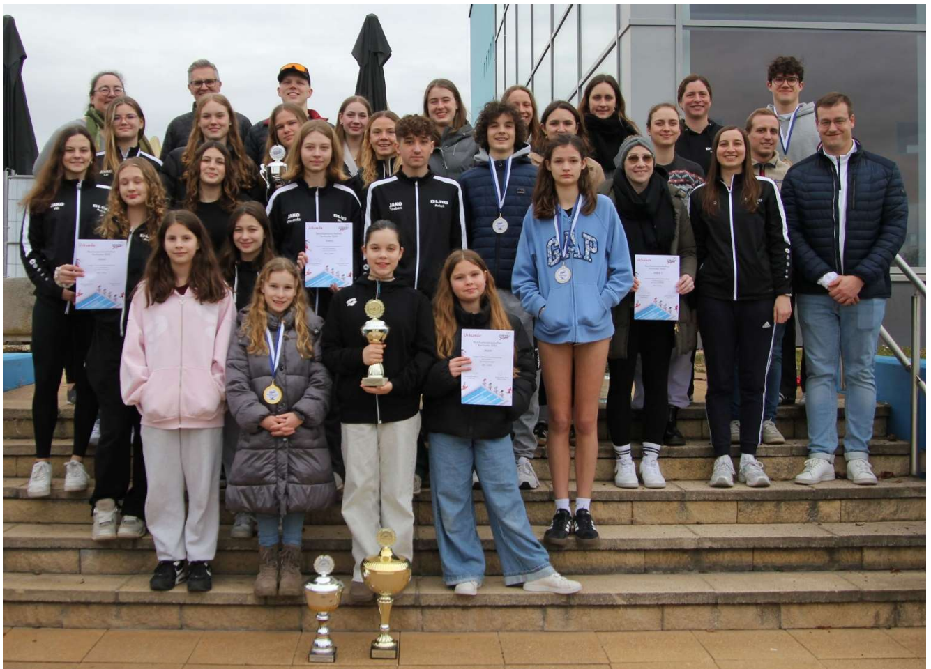
Schwimmer, Betreuer, Wettkampfhelfer – unsere Delegation, hier in Waghäusel bei den Mannschaftswettbewerben der Bezirksmeisterschaften