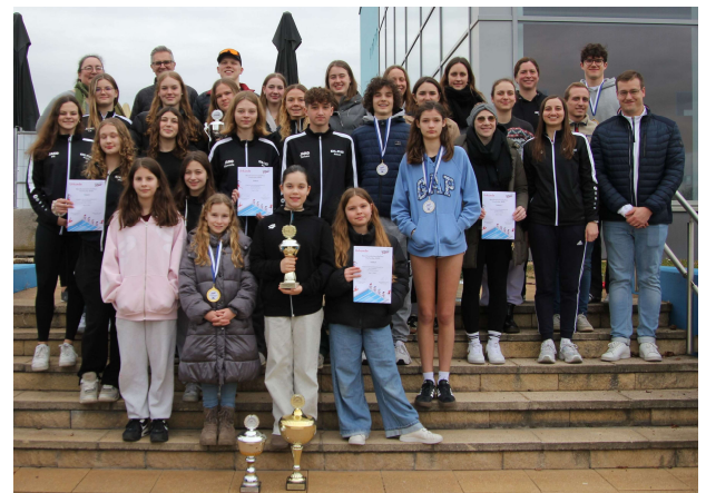
Schwimmer, Betreuer, Wettkampfhelfer – unsere Delegation bei den Mannschaftswettbewerben der Bezirksmeisterschaften

Somit hatten viele unserer teilnehmenden Mannschaften erneut Podestplätze in ihren Altersklassen belegt. Die gute Leistung unserer Rettungssportler spiegelt sich nicht nur über die Platzierung, sondern auch in den erreichten Punktzahlen wider, sodass wir uns gute Chancen ausmachen, mit einer großen Delegation bei den badischen Meisterschaften Ende Juni am Start zu sein.