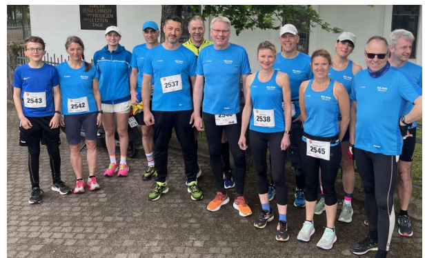
Unsere Gruppe bei der Badischen Meile 2024