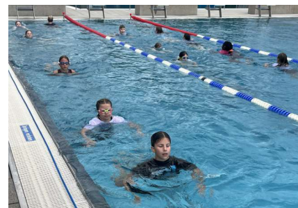
Junior Retter Kurs 2024

Informationen zum Junior Retter gehen den potenziellen Teilnehmern rechtzeitig zu.