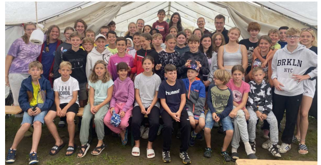
Teilnehmer und Betreuer des Zeltlagers 2024

Hüttenfreizeit in einem Selbstverpflegerhaus in Weidenthal / Pfalz.