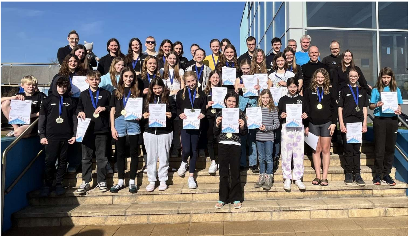
Schwimmer, Betreuer, Kampfrichter, Wettkampfhelfer – unsere Delegation, hier in Waghäusel bei den Mannschaftswettbewerben der Bezirksmeisterschaften