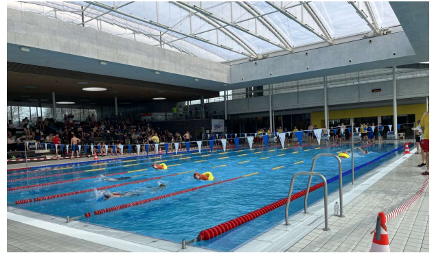
Angenehme Bedingungen im Cabrio-Becken des Karlsruher Fächerbads.

Bezirksmeisterschaften. Aus unserer Ortsgruppe gingen 25 Rettungssportler an den Start.