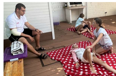
Junior Retter Kurs 2023

Informationen zum Junior Retter gehen den potenziellen Teilnehmern rechtzeitig zu.