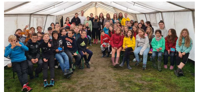
Teilnehmer und Betreuer des Zeltlagers 2023

Eines der Highlights wird sicherlich auch das Zeltlager zu Beginn der Sommerferien werden. Nach dem erlebnisreichen Lager am Achernsee im vergangenen Sommer, plant unsere Jugend im kommenden Sommer die Teilnahme an einem gemeinsamen Lager mit weiteren Ortsgruppen und deren Jugendlichen aus unserem DLRG-Bezirk Karlsruhe.