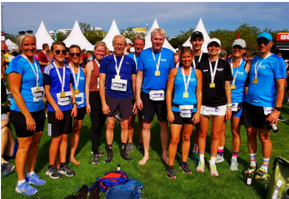
Baden Team-Marathon 2023

Natürlich wird es für alle Aktionen zu gegebener Zeit unser gewohntes Ausschreibungs- und Meldeverfahren geben.