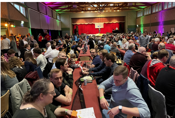
Abschlussveranstaltung mit Siegerehrung

Dieser Erfolg wurde dann am Abend bei der Abschlussveranstaltung mit der Siegerehrung ausgiebig bis in die frühen Morgenstunden gefeiert.