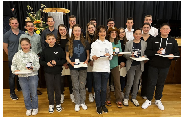
Erfolgreiche Rettungssportler und geehrte Aktive der DLRG

Aus unseren Reihen waren alle Rettungssportler, die im vergangenen Jahr bei den Badischen Meisterschaften im Rettungsschwimmen Podestplätze belegt hatten, geladen. Die Leistungsmedaille der Gemeinde wurde vor vielen Jahren für diesen Zweck kreiert und zeigt Wappen und Rathäuser des Kernorts sowie der Ortsteile.