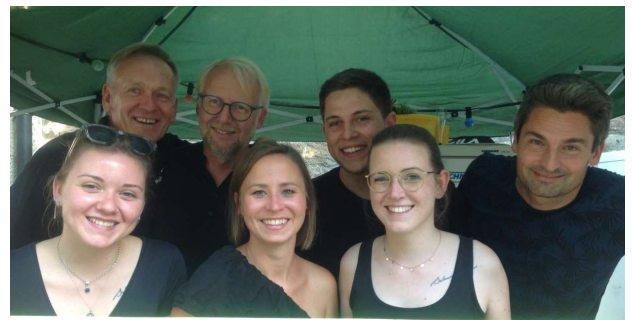
Unser Team hinterm Tresen

Dieser „Freibadhock“ hat sich im Laufe der Jahre zu einem der beliebtesten Festivitäten in Malsch entwickelt. Seit der ersten Veranstaltung im Jahr 2009 sind wir mit einem Cocktailstand zugunsten des Fördervereins mit von der Partie.