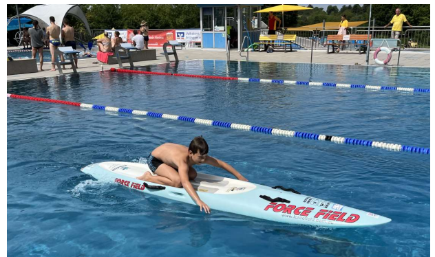
Erste Fortbewegung auf dem Rettungsbrett

Zur Auflockerung lernten die Teilnehmer danach noch Rettungsgeräte wie Gurtretter und Rettungsbrett kennen.