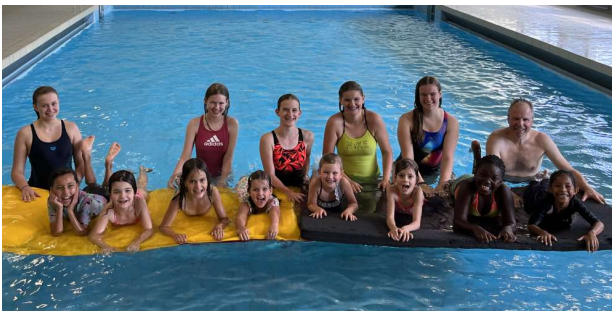
Teilnehmer und Betreuer der Kurse im Juni / Juli

Die Kurse dauern künftig 6 Wochen, die Schwimmstunden finden 2x wöchentlich, mittwochs und donnerstags statt. Die Kinder werden dabei von zwei Ausbildungsteams betreut, einem Mittwochs-Team und einem Donnerstags-Team.