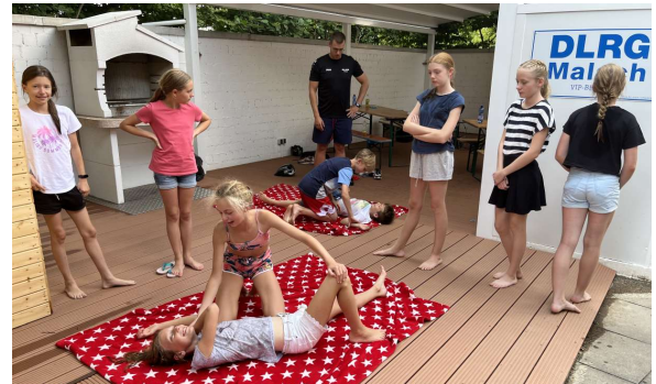
Wie bringe ich einen Bewusstlosen in die Seitenlage ?

ledigt. Auch das Ausfüllen des abschließenden Fragebogens stellte die Teilnehmer vor keine großen Probleme.