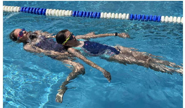
Schleppen einer Partnerin

mit Achselschleppgriff. Sichern des Geretteten durch Festhalten am Ufer