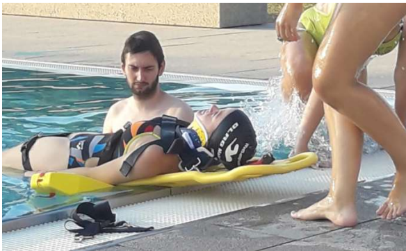
Retten aus dem Schwimmbecken

Die Sanitätsausbildung möchten wir in den kommenden Jahren in unserer Ortsgruppe mehr voranbringen.