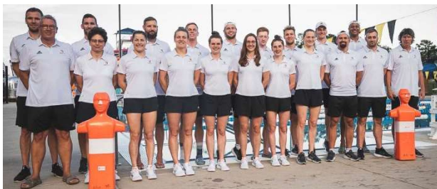
Die Delegation der DLRG in Birmingham / USA.

Sport 1 hat die Spiele live übertragen. In der Sport1-Mediathek oder auf YouTube sind viele der Wettbewerbe noch zu finden. Nachfolgend einige Direktlinks.