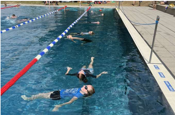
4 Minuten Schweben an der Wasseroberfläche in leichter Freizeitkleidung