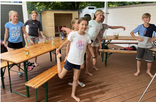
Lösen einer Verkrampfung im Oberschenkel

Danach war Zeit für die Abnahme der praktischen Übungen im Wasser. Nach der guten Vorbereitung am Vormittag war dies zügig er-