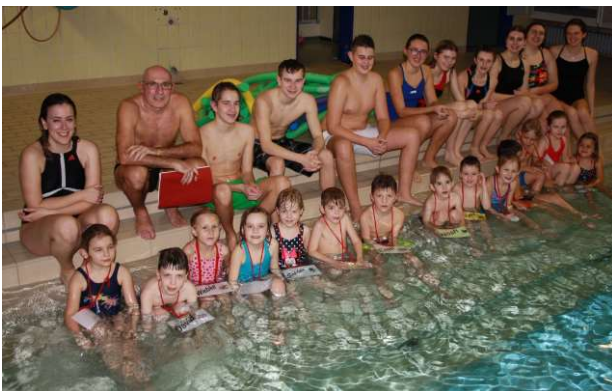
Teilnehmer und Ausbilder der Neuanfänger-Gruppe S1 ...

Umfangreiche Baumaßnahmen in der Hans-Thoma-Schule, waren der Grund, weshalb unser Übungsbetrieb im Lehrschwimmbecken von Juli bis zum Jahresende 2019 ausgesetzt werden mussten. Der gesamte Sportbereich der Schule konnte während dieser Zeit nicht beheizt werden. Jugendliche und Betreuer brannten nach dieser Zwangspause darauf, den Übungsbetrieb nach den Weihnachtsferien wieder aufzunehmen. So konnten wir mit rund dreimonatiger Verzögerung unsere laufenden Anfängerschwimmkurse beenden und am 23. Januar mit den neuen Kursen beginnen.