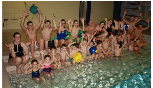
... und des Anfänger-Folgekurses S2

Halbjährlich können bis zu 14 Kinder als Anfänger in den S1-Kurs (Seepferdchen 1) der DLRG aufgenommen werden. Reicht dieser Kurs nicht aus, um nach einer spielerischen Wassergewöhnung die Ziele wie: nach Ringen tauchen, fuß- und kopfwärts einspringen, Schwimmen in Rückenlage, Brustschwimmen und abschließend das Schwimmbabzeichens „Seepferdchen“ zu erlangen, so besteht die Möglichkeit eines Anschlusskurses S2.