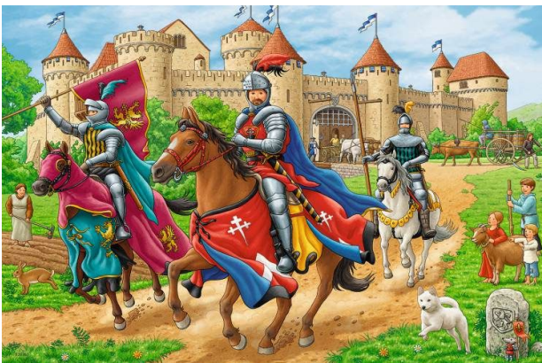
„Burgen, Ritter, Hofnarren“ sind das Motto der diesjährigen Ferienfreizeit Ramberg / Pfalz

Wow – binnen vier Tagen nach der Veröffentlichung der Ausschreibung unseres Ferienlagers im Sommer waren die 32 Teilnehmerplätze für Jugendliche belegt. Weitere Interessenten werden auf eine Warteliste gesetzt und kommen zum Zuge, falls gemeldet Teilnehmer unerwartet ausfallen. Das Betreuersteam freut sich schon auf tolle Tage mit den Kids im Pfälzer Wald um die Burgen Neuscharfenek und Trifels !