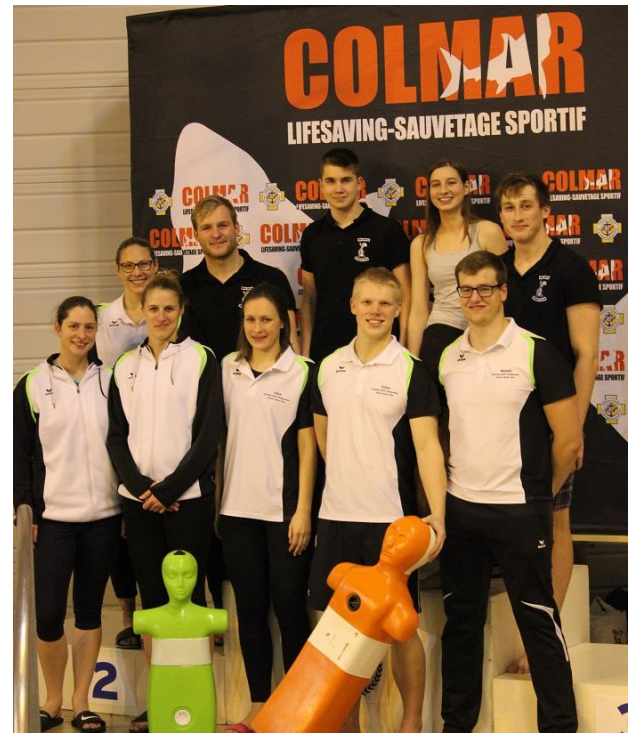
Unsere Delegation beim Colmar Cup

Am 03.02.2019 fand wieder einmal der Colmar Cup im Elsass in Frankreich statt. In diesem Jahr waren wir mit 2 Mannschaften und 9 Einzelteilnehmern am Start.