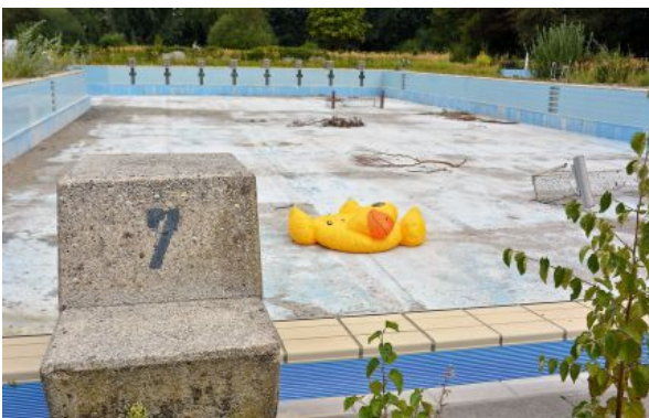
Ein Bild, wie es leider immer öfter in Deutschland auftritt: Bäder von Schließungen betroffen.

Auch wenn Malsch aktuell nicht unmittelbar betroffen ist: seit 2000 sind im Durchschnitt jährlich rund 80 Schwimmbäder in Deutschland geschlossen worden. Seit einiger Zeit steigt die Zahl der jährlichen Ertrinkungsfälle wieder an. Allein im vergangenen Jahr sind in der DLRG bundesweit 4.500 Schwimmprüfungen weniger abgenommen worden als im Vorjahr. Etwa 25 Prozent der Grundschulen haben keinen Zugang mehr zu einem Schwimmbad, oft müssen lange Anfahrtswege in Kauf genommen werden, um überhaupt den von der Kultusministerkonferenz vorgeschriebenen Schwimmunterricht erteilen zu können. Die möglichen Folgen zeichnen sich bereits jetzt ab: Rund 60 Prozent der Zehnjährigen sind keine sicheren Schwimmer (so eine Forsa-Umfrage von 2017). Kinder gehören weiterhin zur Risikogruppe bei den Ertrinkungsfällen.