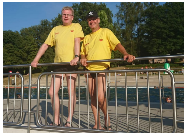
34 Aktive haben in 2018 über 600 Stunden ehrenamtliche Aufsichtsdienste im Freibad geleistet.

Der Bericht über den wöchentlichen Übungsbetrieb wurde unter einem späteren Tagesordnungspunkt zu geplanten Veränderungen im Übungsbetrieb behandelt.