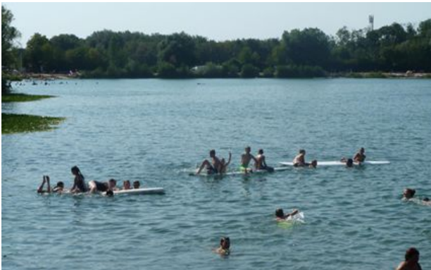
Wasserspaß beim letztjährigen Zeltlager der Jugend