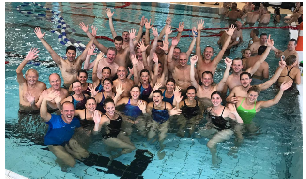
Rettungssportliche Wettbewerbe nicht nur für Jugendliche – hier: unsere Delegation bei den BaWü Masters in Grötzingen.

Es folgten die Berichte der Technischen Leiter. Im Bereich Ausbildung konnten mehrere Rettungsschwimmkurse erfolgreich durchgeführt, sowie während Aktionsnachmittagen im Freibad zahlreiche Früh- und Jugendschwimmabzeichen abgenommen werden.