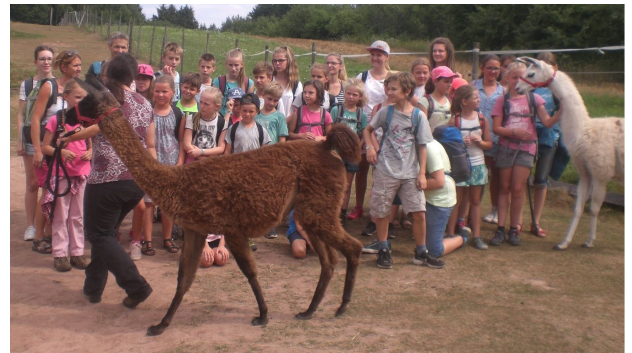
Nicht alltäglich: die Lama-Wanderung bei Landau