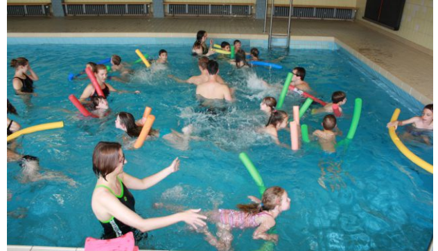
Volles Haus während der Übungsabende im Lehrschwimmbecken in der Hans-Thoma-Schule

auch Wartezeiten für Einsteiger ins Jugendtraining.