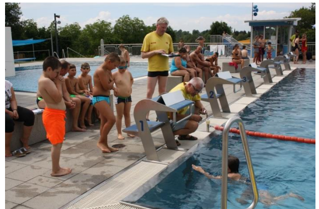
Abzeichen-Aktionsnachmittage im Freibad

Teilnahme an den Bonusprogrammen der Krankenkassen genutzt. Auf Nachfrage wurden auch schwimmerische Disziplinen für das Deutsche Sportabzeichen abgenommen. Im Vergleich zum Vorjahr wurden wir in der Saison 2018 an allen Terminen mit gutem Sommerwetter gesegnet. Insgesamt konnten 82 Jugendschwimmabzeichen (50x Bronze, 21x Silber und 11x Gold) abgenommen werden. Deutsche Schwimmabzeichen für Erwachsene konnten insgesamt 4 ausgestellt werden (1x Bronze, 3x Silber).