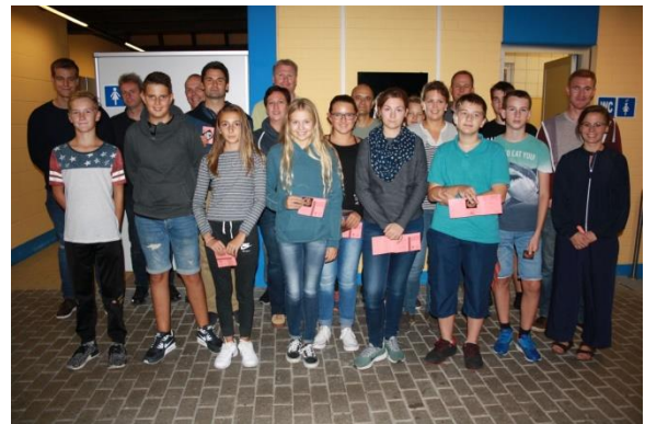
Teilnehmer der diesjährigen Rettungsschwimmkurse

Erwachsene und Jugendliche ab 15 Jahren sind Zielgruppe des RSA Silber. Ambitionierte Rettungsschwimmer ab 16 Jahren können am Gold-Kurs teilnehmen. Diese Kurse sehen im Vorfeld die Teilnahme an einer Ausbildung in Erster Hilfe (9 UE, nicht älter als 2 Jahre) vor.