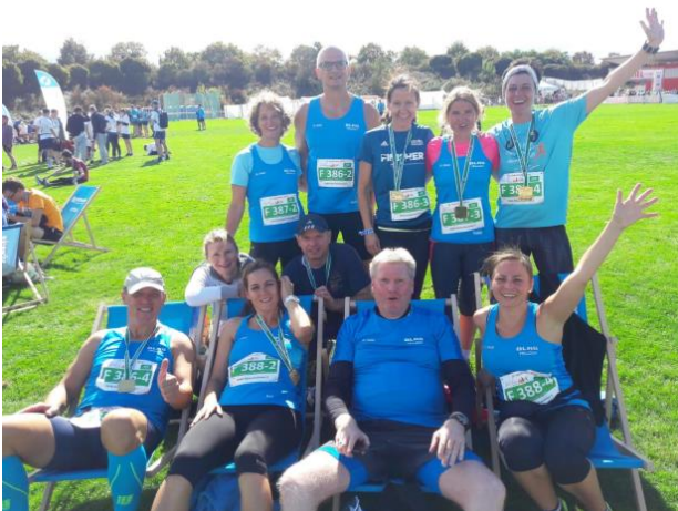
Erholung im „Runner's Heaven“

Nach dem Zieleinlauf konnte jeder seine Finishermedaille in Empfang nehmen. Anschließend wurde im Runner's Heaven die Erholung eingeläutet und die Erfahrungen von der Strecke ausgetauscht.