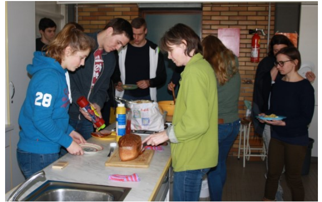
Ohne Mampf kein Kampf !