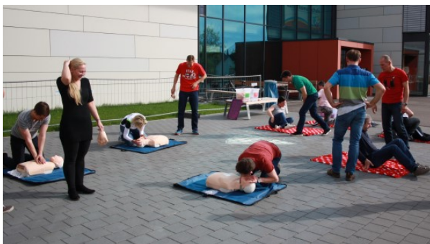
Durchführung der Wiederbelebung