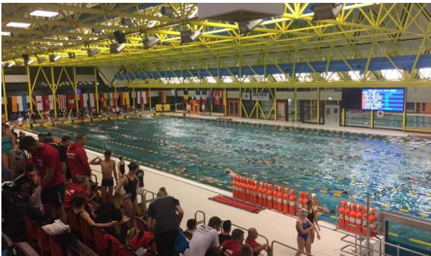
Schwimmhalle der Sportschule der Bundeswehr in Warendorf.