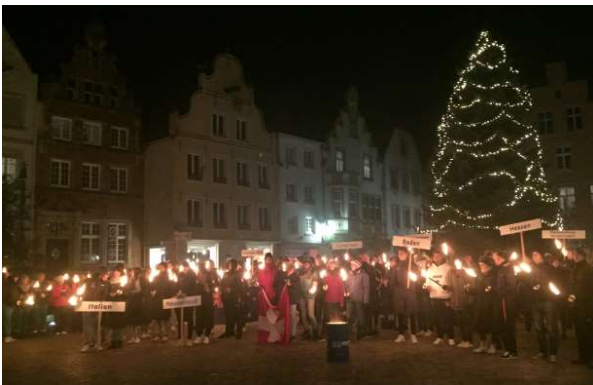
Feierliche Eröffnung der Veranstaltung auf dem mittelalterlichen Marktplatz in Warendorf.