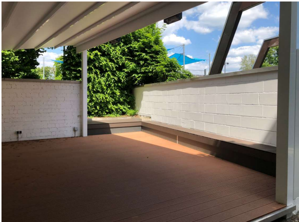
Im März und April wurde eine ausfahrbare Überdachung installiert sowie Bodenpaneele montiert.