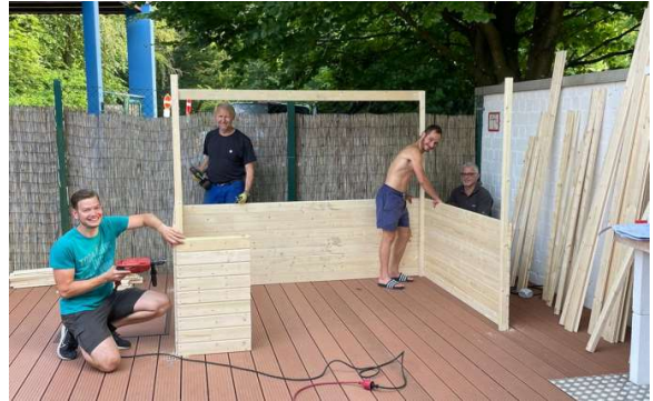
Gerätehäuschen für Tischgarnituren, etc.

Für Juli sind bereits die ersten Kurse und Veranstaltungen der Jugend in unserem neuen Freiluftschulungsraum geplant.