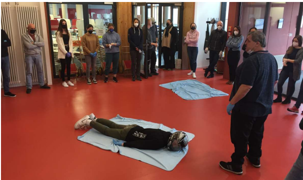
Praktische Übung bei der EH-Ausbildung: die Helmabnahme