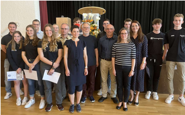
Erfolgreiche Rettungssportler bei Wettbewerben in 2019.

Nach mehreren vergeblichen Anläufen fand am 13.05. die Ehrungsveranstaltung der Gemeinde statt, die aus Gründen der Pandemie im März 2020 kurzfristig abgesagt werden musste. Geehrt wurden sportliche Leistungen aus dem Jahr 2019. Viele unserer Rettungssportler haben damals bei Bezirks- und Landesmeisterschaften der Jugend oder BaWü Seniorenmeisterschaften Podestplätze erreicht.