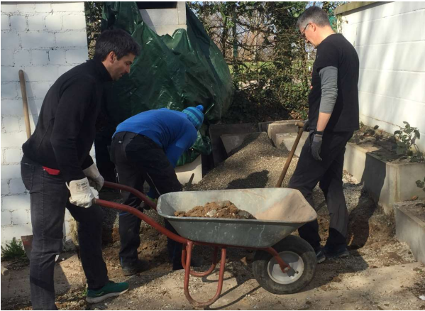
Die ersten Arbeitsdienste ...