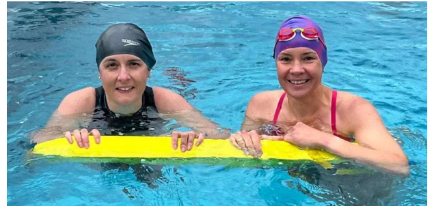
Hut ab – bei noch frischen Wassertemperaturen Mitte Mai RSA Silber aufgefrischt.

Anforderungen für das RSA Gold. Am Sonntag, dem 11.09. planen wir die Ausgabe der Rettungsschwimmabzeichen im Rahmen eines kleinen Saisonabschlusses im Freibad.