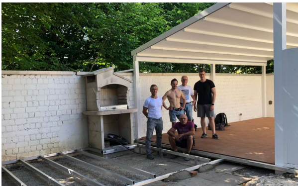
Der bestehende Grill wurde in die Anlage integriert.

Der größte Teil der Arbeiten konnte im Juni abgeschlossen werden. Ende des Monats fand ein kleines Einweihungsfest mit dem an den Arbeitsdiensten beteiligten Personenkreis statt.