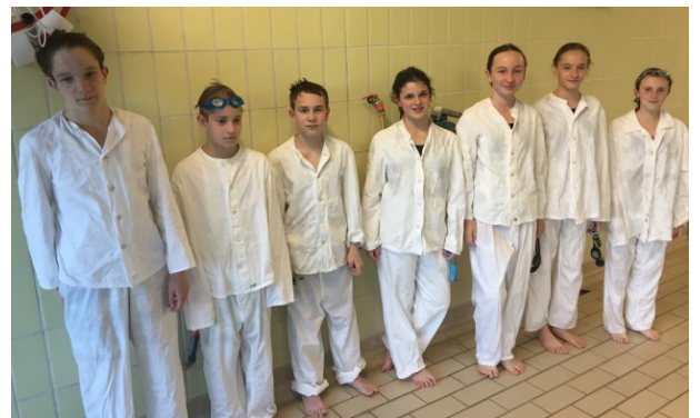
Bereit zum Kleiderschwimmen