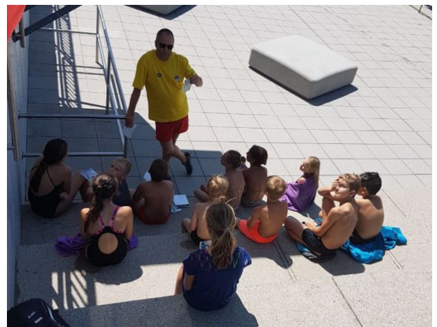
... sind auch die Baderegeln Bestandteil der Jugend-schwimmabzeichen.