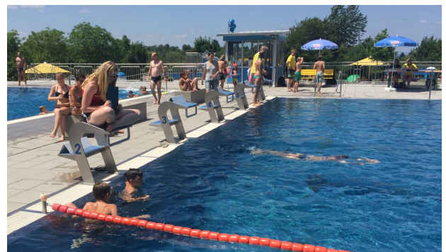
Neben schwimmerischen Disziplinen ...