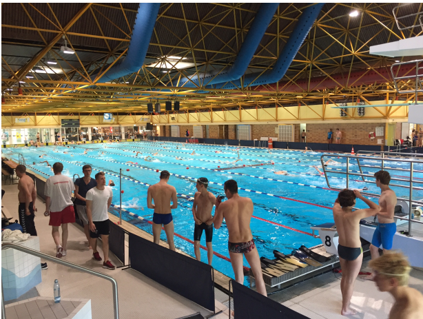
Rettungssport-Showdown in Paderborn: die Schwimmoper

Am 27. + 28.05.2017 trafen sich die besten deutschen Rettungssportler zum 3. DLRG Cup / Pool in der Paderborner Schwimmoper. Unter den Augen der neuen Bundestrainerin der DLRG, Elena Prella hatten die teilnehmenden Athleten die Chance sich für die World Games im Juli in Breslau und die Europameisterschaften im September in Belgien zu qualifizieren.