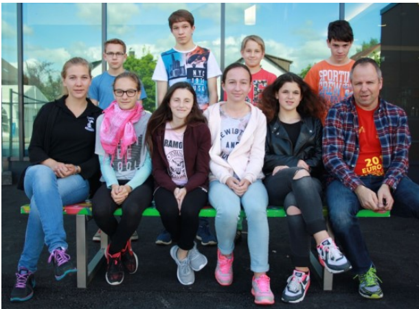
Teilnehmer und Durchführende des Bronze-Kurses

des Kurses war die Erlangung des Rettungsschwimmabzeichens in Bronze . An drei Vormittagen wurde von 9.00 – 13.00 Uhr die Theorie für die Teilnehmer in der Hans-Thoma-Schule durchgeführt. Die Jugendlichen erhielten Einblicke in die verschiedenen Arten der Selbst- und Fremdrettung.