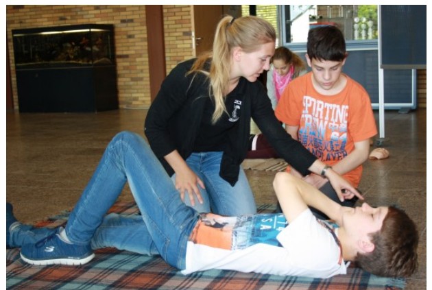
Durchführung der Seitenlage

Die Praxiseinheiten waren für die meisten Jugendlichen nur Formsache. Wir gratulieren den teilnehmenden Jugendlichen für ihre erfolgreiche Teilnahme! Malsch hat jetzt sieben Rettungsschwimmer mehr, die bei Interesse