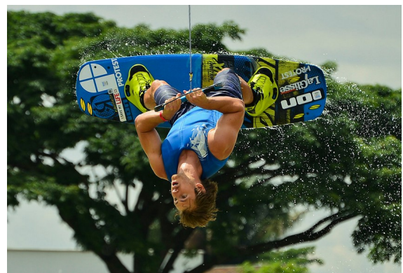
Nicht alltäglich bedeutet jedoch nicht unspektakulär: Randsportarten bei den World Games.

Diese Spiele der „Nicht-Olympischen Sportarten“ werden jeweils im Jahr nach den Olympischen Spielen ausgetragen. Die World Games beinhalten zahlreiche exotische Sportarten wie Air Sports (Gleitschirm), Frisbee, Rugby, Orientierungslauf, Tauziehen, Beach Handball, Bowling, Squash, Trampolin, Sumo, Speed Skating, ... und Lifesaving , den Rettungssport, wie ihn viele unserer Aktiven der DLRG betreiben. Im Lifesaving können die bei der letzten WM in den Niederlanden sechs erfolgreichsten Nationen bei den World Games antreten, darunter auch die Nationalmannschaft der DLRG.