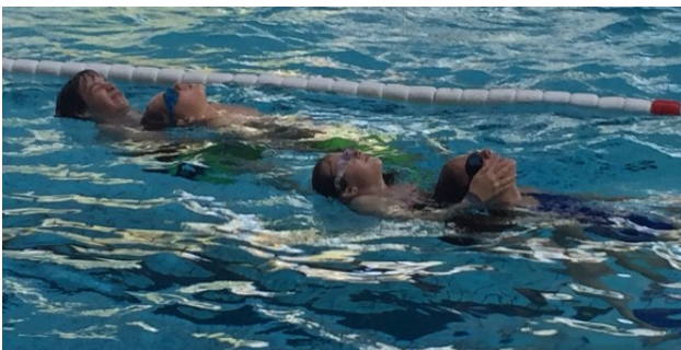
Schleppen eines Verunfallten

Die Befreiung aus möglichen Umklammerungen, kombinierte Übungen zur selbständigen Rettung, bis hin zur Erstversorgung Verunfallter waren Inhalt, ebenso wurden den Kids theoretische Kenntnisse vermittelt, etwa über Herz und Blutkreislauf, dem Verhalten bei Eisunfällen, oder ganz allgemein das vielfältige Aufgabenspektrum der DLRG vorgestellt.