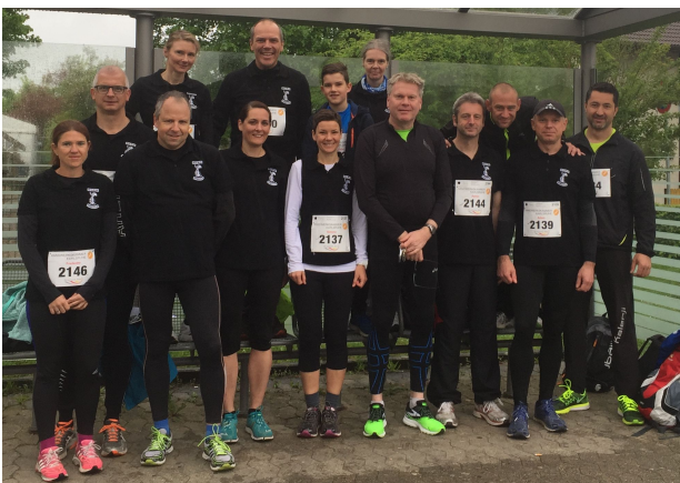
Die Teilnehmer der DLRG vor dem Start der Badischen Meile

Seit 1990 wird in Karlsruhe der Traditionslauf „Badische Meile“ veranstaltet. Die Badische Meile ist ein historisches Längenmaß. Acht Kilometer, 888 Meter und 89 Zentimeter legte Markgraf Carl Friedrich anno dazumal mit seinem Gefolge in zwei Wegstunden durch den Hardtwald zurück und definierte die längste Landmeile Deutschlands. Mit Einführung des Metersystems entstand die "krumme Zahl" von 8,88889 Kilometer.