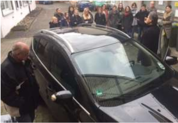
Retten aus dem Fahrzeug

Am 18.02. fand in Kooperation mit der „Medie Ambulanz Kuppenheim“ unser diesjähriges Angebot der EH-Ausbildung statt.