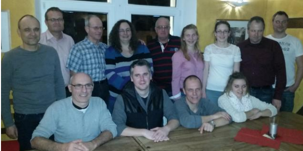
Die Vorstandschaft der DLRG für die Jahre 2016 / 2017

Kunz , sowie zweier Jugendvertreter aus dem Jugendvorstand.