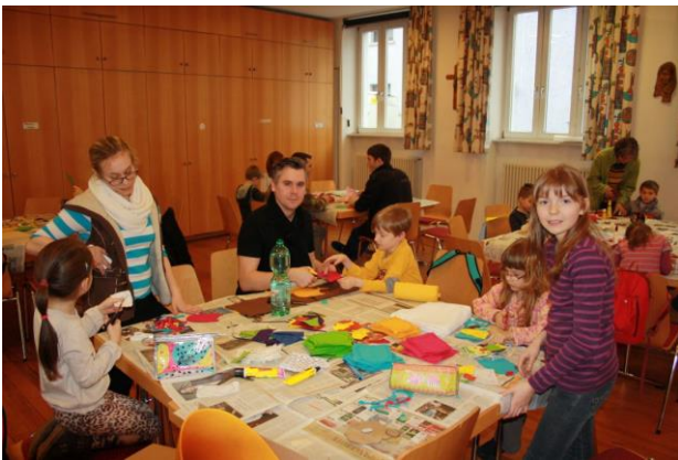
Osterbasteln im Theresienhaus

Beim Osterbasteln am 05. März im Theresienhaus, gab es mal wieder allerhand zu tun. Die 39 teilnehmenden Kids im Alter zwischen 5 und 12 Jahren konnten sich hierbei zwischen fünf tollen Oster- und Frühlingsmotiven entscheiden: Hasen, Eulen aus Filz, Schnecken, Enten und ein Osterlamm.