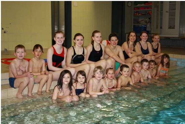
Die aktuelle Anfängergruppe A1 ...

Anfängern der DLRG sind sehr begehrt und die Wartelisten demzufolge sehr lang.