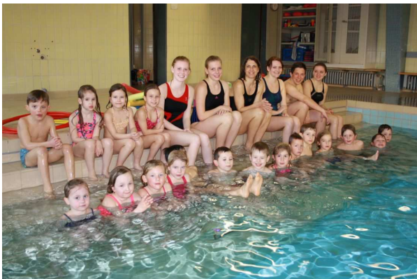
Und die Gruppe A2 ...