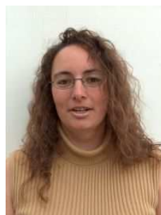
Heike Guhl Meisterschaften