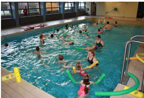
Auf dem Weg zum „Seepferdchen“: unsere Kinderschwimmausbildung im Lehrschwimmbecken

Halbjährlich können bis zu 16 Kinder als Anfänger in die Schwimmkurse der DLRG aufgenommen werden. 34 Kinder im Alter von fünf oder sechs Jahren belegen derzeit einen Anfänger- oder Folgekurs der DLRG im Lehrschwimmbecken der Hans-Thoma-Schule.