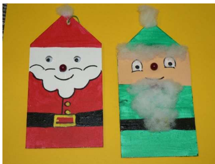
Morgen kommt der Weihnachtsmann ...