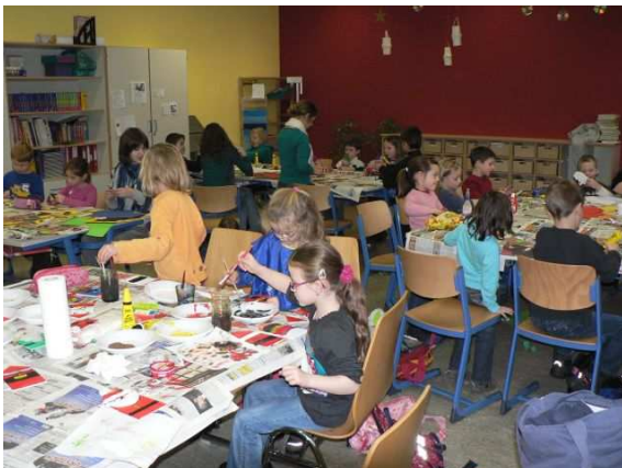
Ein Highlight für unsere Jüngsten: das Weihnachtsbasteln

Am Nachmittag des 13.12. wurden wieder die Bastelscheren gewetzt. Unsere Jugendlichen von 5 bis 10 Jahren waren eingeladen, Weihnachtsschmuck zu Basteln. Nikoläuse, Elche u.v.m. werden sicherlich dieser Tage zahlreiche Wohn- und Kinderzimmer zieren.