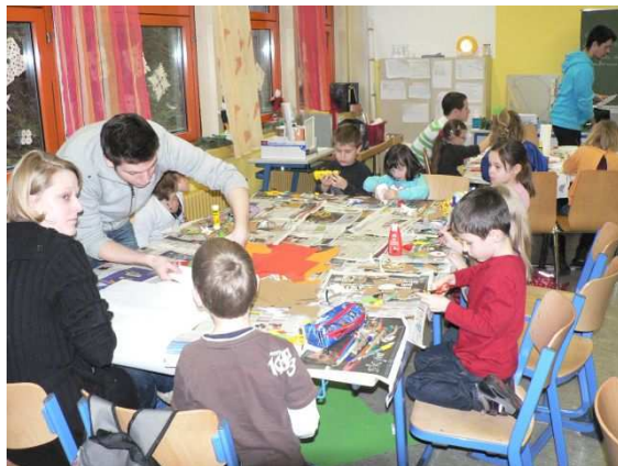
Großer Andrang an den Basteltischen