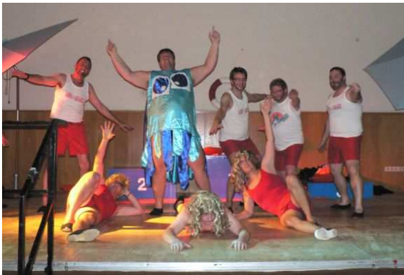
Landgraben-Ballett der GroKaGe

Die Abschlussparty dauerte bis 3.00 Uhr an. Etwa 100 Teilnehmer nutzten danach die Möglichkeit der Übernachtung in der hiesigen Realschule. Nach einem zünftigen Frühstück machten sich die Letzten dann am Sonntagmorgen auf den Heimweg.