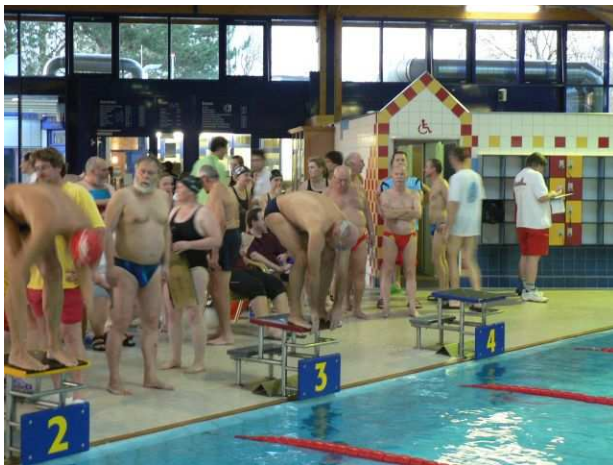
Wettkampftrubel im Cuppamare

Nach der Nivea-Trophy am Muggensturmer Badensee im Sommer 2004, haben wir am 13.11.10 in Kuppenheim mit den 15. Baden-Württembergischen Seniorenmeisterschaften unsere zweite überregionale Großveranstaltung gemeistert. Knapp anderthalb Jahre bereiteten wir dieses Event im kleinen Kreis vor.