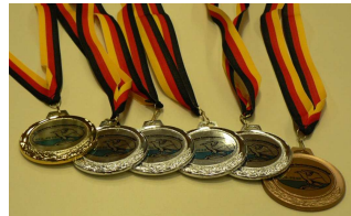
Gebendet von soviel Silber und Gold ...

Im kommenden Jahr finden die Deutschen Seniorenmeisterschaften in Geislingen an der Steige statt. Sicherlich wird die DLRG Malsch auch dann wieder mit von der Partie sein.