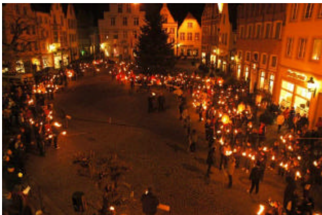
Feierliche Eröffnung des Deutschlandpokals auf dem historischen Marktplatz in Warendorf

Parallel zu den schwimmerischen Leistungen unserer Jugendlichen und Senioren konnten sich in den vergangenen Jahren auch regelmäßig ausgebildete Wettkampfrichter unserer Ortsgruppe bei verschiedenen Veranstaltungen im Indoor und Outdoor-Bereich des Rettungssports hervortun.