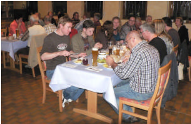
Gemütliche Runde zum Ausklang unseres Ausflugs