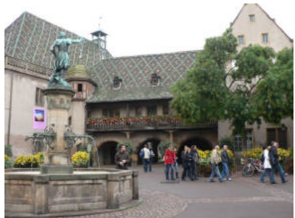
Das Koifhus, die ehemalige Zollstation

Nach dem gemeinsamen Mittagessen blieben uns noch etwa zwei Stunden Zeit, um Gerberviertel, Fischerufer und Martinsmünster nochmals auf eigene Faust zu erkunden.