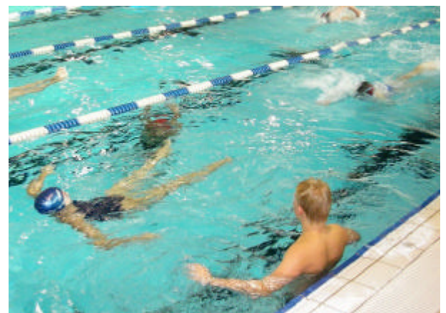
Staffelwechsel beim 4x25m Rückenschwimmen ohne Armtätigkeit

Die weite Anreise, quer durch das Bundesgebiet trat unsere Delegation in zwei PKWs an. Die Unterbringung erfolgte in einer Schule. Freitags starteten die Wettbewerbe in der Mannschaftswertung. Hier erreichte unser Team nach anstrengenden Wettkampf auf der 50m-Bahn Platz 26.