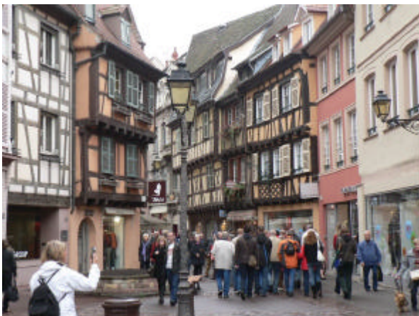
Führung durch das historische Colmar

Am 10.10. fand der diesjährige Tagesausflug unserer Erwachsenengruppe statt. Ziele waren die mittelalterlichen Städtchen Colmar und Ribeauville im südlichen Elsass. Leider hatten wir etwas Pech mit dem Wetter, denn den ganzen Tag über versuchten Regenschauer vergeblich unsere gute Laune zu trüben.