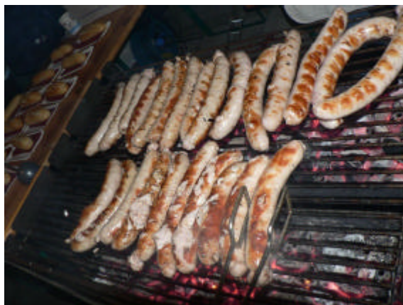
„Objekte der Begierde“: unsere originalen Würste aus Thüringen

An den drei Donnerstagen vor Heilig Abend finden wieder die Weihnachtsmarktabende in der Hauptstrasse in Malsch statt. Auch wir werden wieder mit von der Partie sein und die beliebten Original Thüringer Würstchen , Glühwein, Kinderpunsch und andere Getränke anbieten und freuen uns auf regen Besuch !