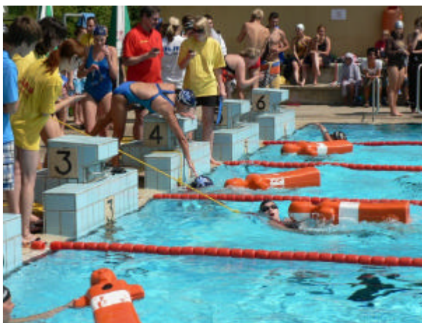
Leinenstaffel: Kurz vor dem Ziel