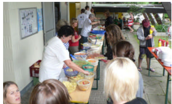
Nach dem Wettkampf galt es viele hungrige Mäuler zu stopfen.