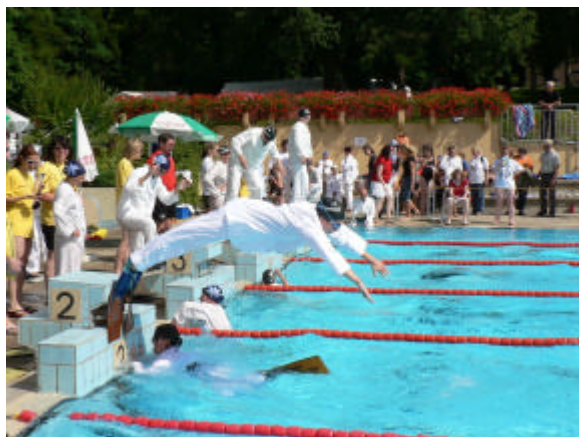
Kleiderschwimmen mit Flossen

Nach anstrengendem Wettkampf und kleiner Stärkung wurde im Rahmen einer Beachparty die Siegerehrung durchgeführt. Hierbei wurde allen Teams die Teilnahme versüßt, die Erstplatzierten durften sich darüber hinaus über schöne Wanderpokale freuen.