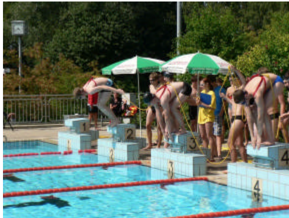
Start zur Rettungsleinstaffel

Am Folgetag hieß es wiederum: Leinen ins Wasser, für 41 Teams aus elf Ortgruppen, die sich beim Storchencup , unserem jährlich stattfindenden Freundschafts-Rettungsvergleich maßen. Alle Mannschaften hatten vier Disziplinen, darunter eine Gaudistaffel zu bewältigen.