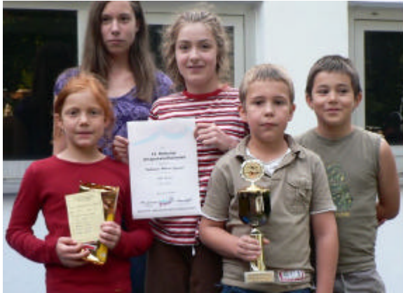
In diesem Jahr noch Konkurrenzlos: die Jugendmannschaft des Taekwondo

nicht sehr groß. Die Kids des Taekwondo traten konkurrenzlos an und durften erstmals den neuen Wanderpokal in Empfang nehmen.