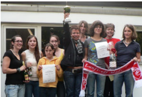
Das stark verjüngte Team der Turnerinnen (links) und die erfolgreichen Pokalverteidiger des Lauftreff

Auch bei den Damen war das Teilnehmerfeld recht überschaubar. Wie im vergangenen Jahr gewannen die Schwimmerinnen des Lauftreff Malsch . In diesem Jahr konnten sie sich allerdings gegen die Seriensieger früherer Jahre, den Turnerinnen des TV Malsch durchsetzen.