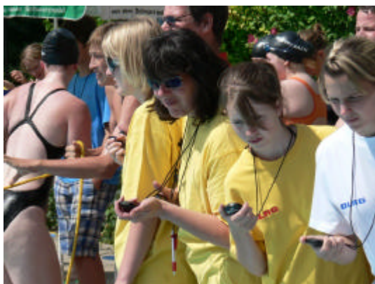
Wer hat die schnellste Zeit?