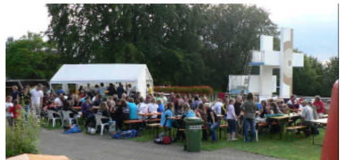
Gespanntes Warten auf die Siegerehrung