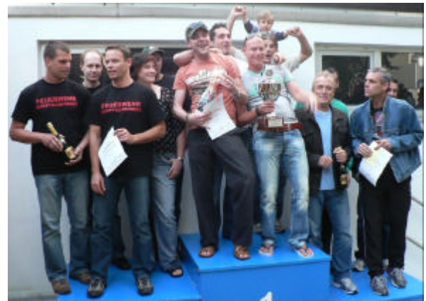
Ehre, wem Ehre gebührt: die Grässer Marlins mit dem dritten Sieg in Folge, ganz oben auf dem Siegetreppchen. Links, die zweitplatzierten „Kampfschwimmer“ der Feuerwehr und rechts die Motorradfreunde auf Rang 3.

Bei den Herren konnte sich das Siegerteam der vergangenen beiden Jahre, die Grässer Marlins erneut knapp behaupten und den begehrten Wanderpokal nunmehr in festen Besitz übernehmen.