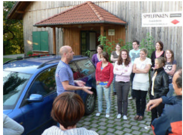
Einweisung Retten aus dem Fahrzeug

Durch praktische Nachweise, beispielsweise dem Kleiderschwimmen und anderen Grundschwimmarten, sowie im Strecken- und Tief-tauchen, stellten die Teilnehmer ihre grundlegende Fitness unter Beweis.