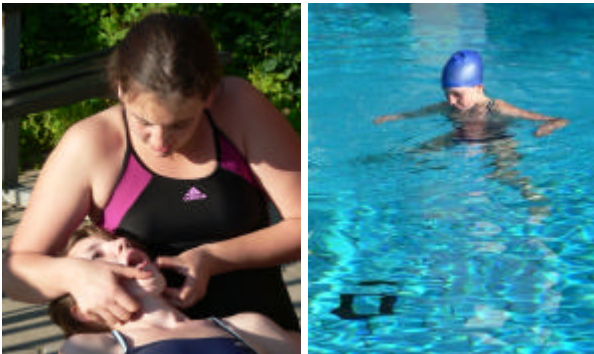
Prüfung auf Fremdkörper im Rachenraum vor notwendiger Beatmung und Tieftauchen auf 3,80m