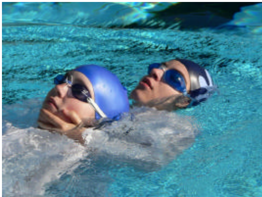
Schleppen eines Verunfallten in Kleidung