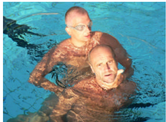
Schleppen mit dem Fesselschleppgriff