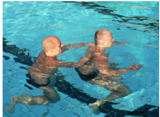
Befreiung aus einem Halswürgegriff