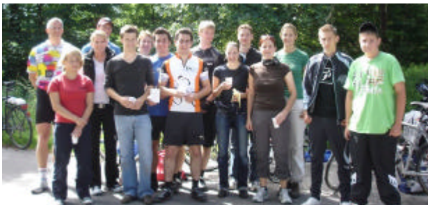
Eine unserer teilnehmenden Radelgruppen

Gerne kommen wir Einladungen örtlicher Vereine zu Festen bzw. Ortsturnieren nach. Im Juni standen gleich mehrere solcher Aktivitäten an. Bei der Rhein-Alb-Murg-Radtour der Radsportabteilung des FV Malsch sind wir seit Jahren eine feste Größe. Mit 1521 geadelten Kilometern konnten wir, zwar denkbar knapp mit nur 43 km Vorsprung auf den Boule-Club, zum dritten Mal in Folge den Wanderpokal gewinnen. Dieser findet nun seinen festen Platz in unserem Vereinsraum.