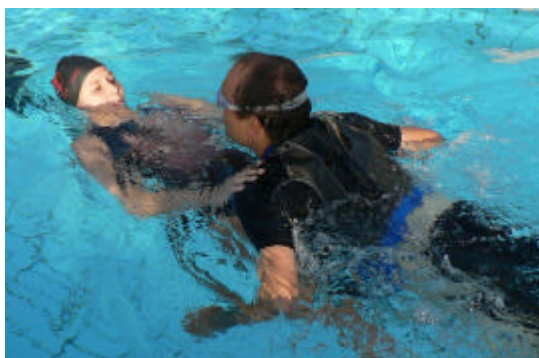
Transportschwimmen – Schiebetechnik