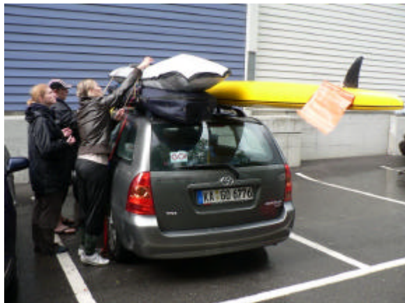
Da verrutscht nix: zwei Boards und ein Rettungskajak – unser teilweise geliehenes Equipment beim Victorinox-Cup.

Der Outdoor-Rettungssport erfordert ein vielfältiges Equipment. Neben Gurtrettern und Flossen kommen Rettungsbretter (Boards) und -kajaks (Surf Skis) zum Einsatz. Entsprechend aufwendig ist es, die Materialien zu den Wettkampforten oder zu Trainingszwecken an einen geeigneten See in unserer Umgebung zu transportieren. In unserer Juni-Ausgabe berichteten wir über ein durchgeführtes Trainingswochenende am Fermer See.