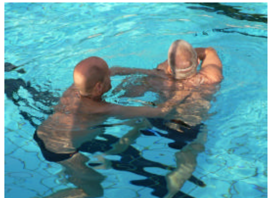
Hebeln und Befreien