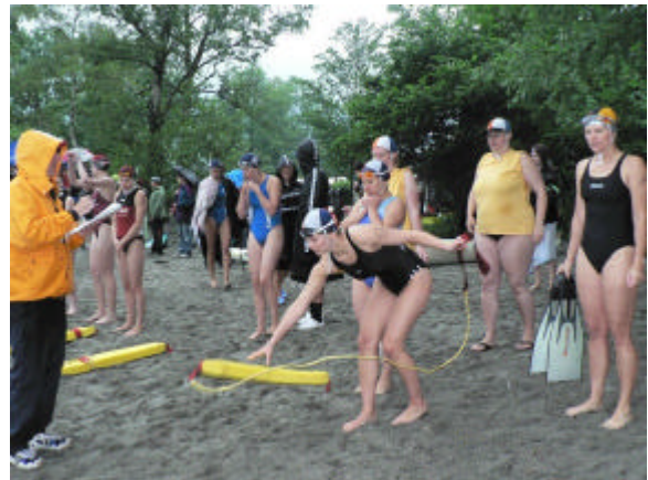
Vor dem Start zur Rescue-Tube Rescue

Trotz der widrigen äußeren Umstände gingen unsere Amazonen auch beim Wettkampf mit Spaß zu Werke. Sie konnten stets den Anschluss ans Teilnehmerfeld halten und verpassten mehrmals nur knapp die Qualifikation für die nächsten Läufe.