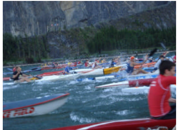
Start des Papa Joe's Surf Ski Race

sportler aus Frankreich, Belgien, den Niederlanden und allen Teilen Deutschlands angereist.