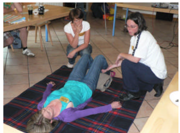
Erläuterung verschiedener Lagerungsarten

Kombinierte Übungen zur selbständigen Rettung Verunfallter aus dem Wasser, Griffe zur Befreiung aus möglichen Umklammerungen bis hin zu Kenntnissen über Herz und Blutkreislauf waren weitere Schwerpunkte. Ebenso die Durchführung der Herz-Lungen-Wiederbelebung, sowie Verhalten und Massnahmen bei möglichen Unfällen im Haushalt oder im Straßenverkehr.