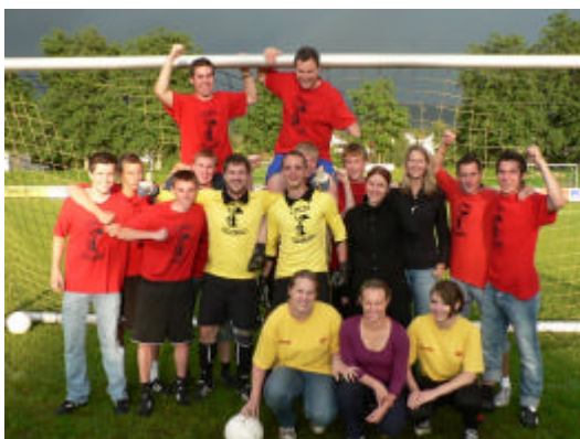
Elfmeterschützen mit hoher Trefferrate

Zum Abschluss des FV Festes in Malsch traten wir mit mehreren Mannschaften zum Elfmeterschießen an. Unsere Herren belegten als Titelverteidiger in diesem Jahr Platz 4, dafür durften sich diesmal unsere Damen über den Gewinn des Wanderpokals freuen.