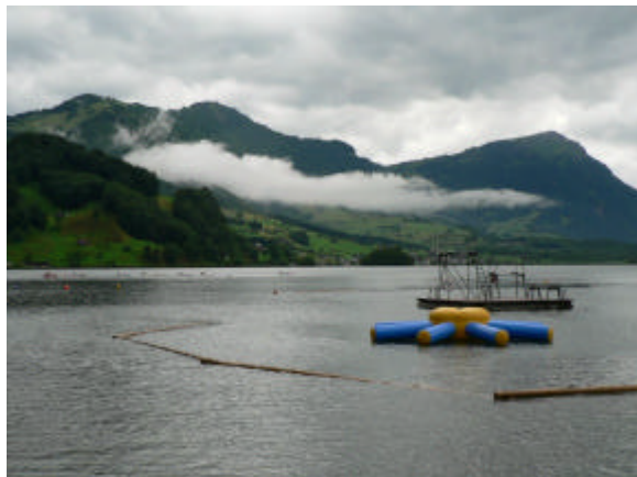
Seebad Seewen am Lauerzer See

Anfang Juni sind wir zu unserem ersten Freundschaftswettkampf im Ausland angetreten. Die SLRG Innerschweyz lud zum Victorinox-Cup ein, einem Freigewässer-Wettkampf am Lauerzer See, der zwischen Zürich und Luzern gelegen ist.