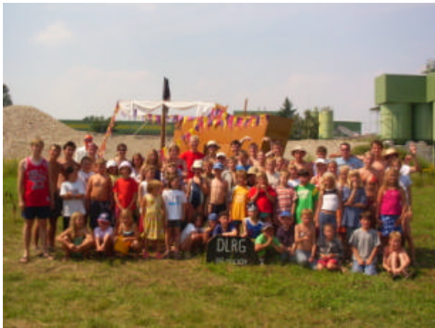
Die Piratenmeute eines unserer früheren Zeltlager.