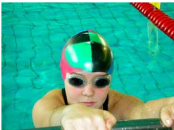
Das Wettkampffahr 08 fest im Visier