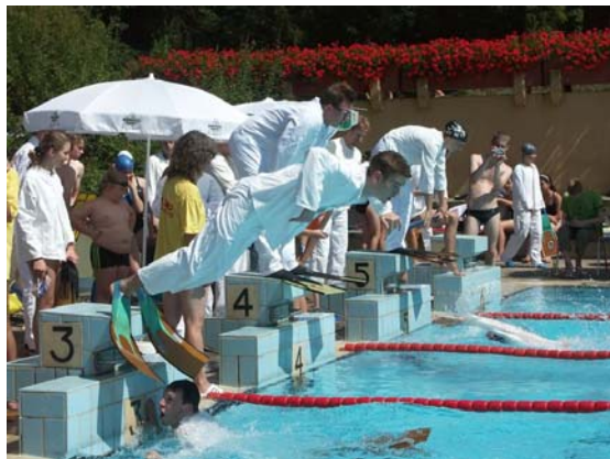
Kleiderschwimmen mit Flossen

Nach anstrengendem Wettkampf und kleiner Stärkung wurde im Rahmen einer Beachparty mit Disco die Siegerehrung durchgeführt. Hierbei wurde allen Teams die Teilnahme versüßt, die Erstplatzierten durften sich darüber hinaus über schöne Wanderpokale freuen.