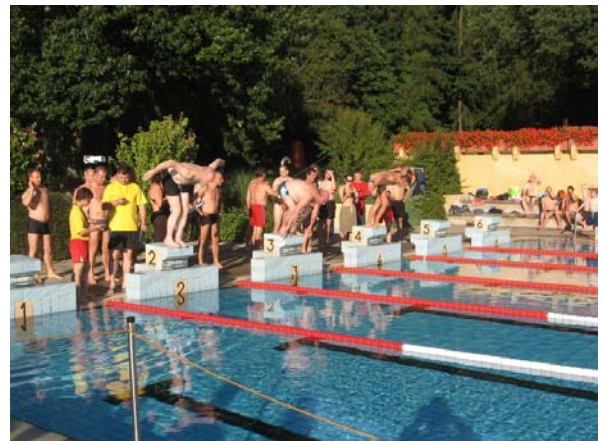
Start eines Herrenlaufs

Am Freitag, den 13. Juli 2007 fand zum 19. Mal unser Ortschaftsschwimmen im Freibad statt. Trotz dieses verheißungsvollen Datums hatten wir Glück, denn nach einer wochenlangen Schlechtwetterperiode schlug das Wetter pünktlich um.