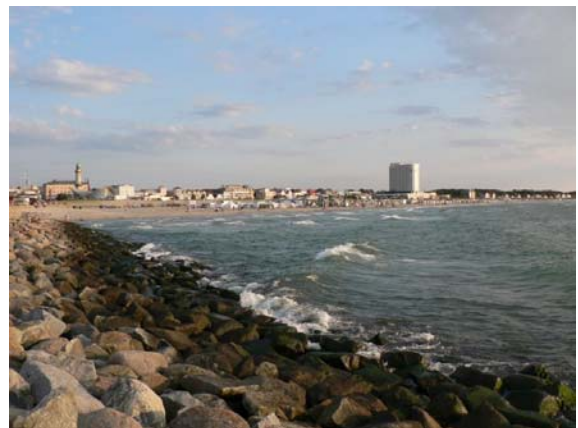
Der Strand von Warnemünde

Beim Nivea Cup acht Tage später, dem wichtigsten europäischen Open-Water-Event im Rettungsschwimmen musste sich unsere Nationalmannschaft im Rettungsschwimmen am Strand von Warnemünde lediglich um 8 Punkte den Outdoor-Spezialisten aus Großbritannien geschlagen geben.