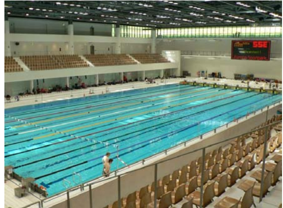
Bereit für die Poolwettkämpfe der Rescue 2008: das Berliner Schwimmstadion an der Landsberger Allee.

Weitere Infos und Ergebnisse siehe unter www.dlrg.de/Junioren-Rettungspokal.2699.0.html .