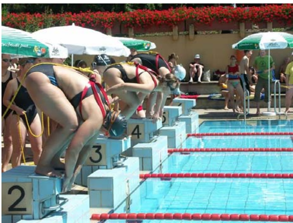
Start zur Rettungsleinenstaffel

Am Folgetag hieß es wiederum: Leinen ins Wasser, für 28 Teams aus acht Ortgruppen, die sich beim Storchencup , unserem jährlich stattfindenden Freundschafts-Rettungsvergleich maßen. Alle Mannschaften hatten vier Disziplinen, darunter eine Gaudistaffel zu bewältigen. Der Wettergott hatte einen der heißesten Tage des Jahres aufgeboten, sodass allerbeste Voraussetzungen gegeben waren.